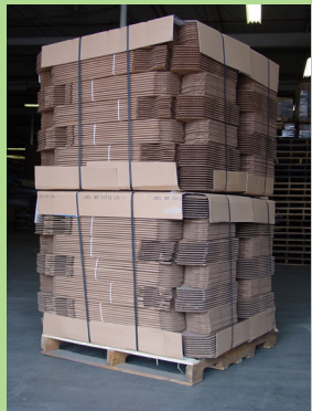
Esta foto muestra 280 tambores hexagonales de 15 galones. Los tambores hexagonales TCC proporcionan una relación de ahorro de espacio de 10:1 en comparación con tambores de plástico, metal o fibra

AHORRO DE ESPACIO, ALTERNATIVA DE BAJO COSTO A BIDONES DE PLÁSTICO, METAL O FIBRA